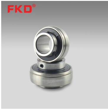
UC 300 (heavy-duty)